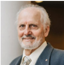
Γιώργος Παξινός, Πανεπιστήμιο Νέας Νοτίου Ουαλίας Διακεκριμένος Καθηγητής Ιατρικών Επιστημών του Πανεπιστημίου της Νέας Νοτίου Ουαλίας και NHMC Senior Principal Research Fellow, Neuroscience Research Australia

Τίτλος Ομιλίας The adolescent period of neurocognitive maturation