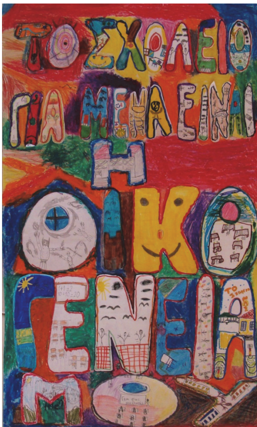
Το σχολείο για μένα είναι η οικογένειά μου

«Το σχολείο για μένα είναι η οικογένειά μου», «...είναι οι φίλοι μου», «...είναι οι δραστηριότητες», «...είναι η συνεργασία», «...είναι η μάθηση».